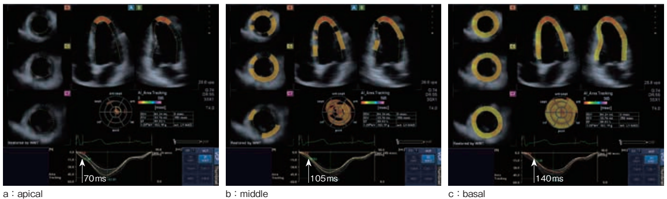
図3 area change ratioによるAI (健常例)